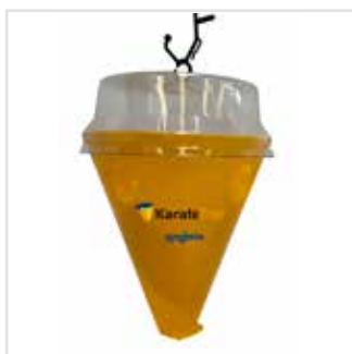
KARATE TRAP® B specijalno dizajnirana lovka za maslinovu muhu

Nakon što muha uđe u lovku, izložena je insekticidu na bazi lambda cihalotrina kojim je premazan poklopac lovke s unutarnje strane. Ako u bilo kojem slučaju muha pokaže otpornost na insekticid, uginut će unutar lovke zbog gladovanja, jer praktički ne može izaći iz lovke. Ova dvostruka kombinacija kontrole čini KARATE TRAP® B sustavom koji onemogućuje pojavu rezistencije.