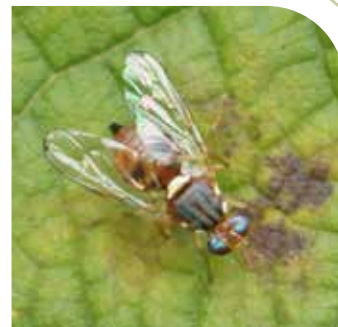
Maslinova muha Bactrocera oleae

KARATE TRAP® B je lovka koja je unaprijeđena u odnosu na standardne lovke koje se danas nalaze na našem tržištu. Osim što muhu privlači bojom i suhim atraktantom, izvedba lovke je vrlo kvalitetna, nije podložna utjecaju kiše i aktivna je 120-160 dana što u praksi znači cijeli vegetacijski period.