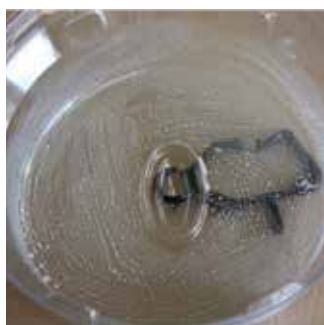
Poklopac lovke iznutra je premazan insekticidom lambda cihalotrin