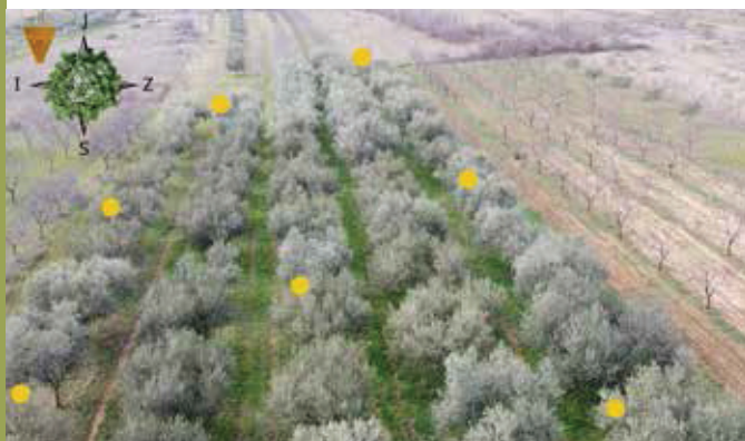
Raspored KARATE TRAP® B lovki u masliniku