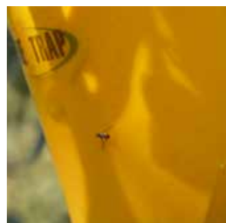
Boja lovke točno određenog spektra ujedno služi kao vizualni atraktant za privlačenje maslinove muhe