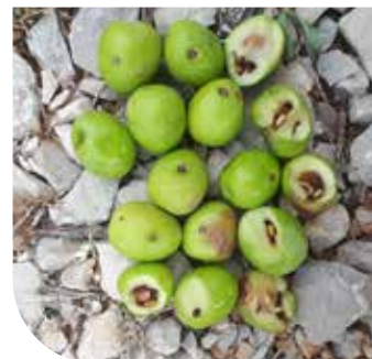
Štete od maslinove muhe