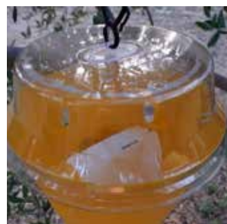
Unutar lovke nalazi se suhi atraktant dobro zaštićen od kiše sposoban privlačiti muhe 120-160 dana