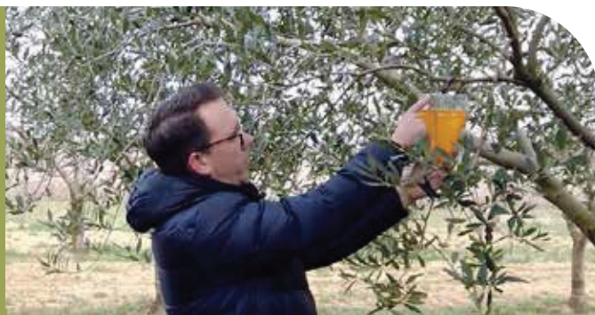
Postavljanje KARATE TRAP® B lovke

Lovke je preporučljivo ostaviti i nakon berbe sve do sljedeće vegetacije. Bez obzira što nema plodova u toplim područjima ovaj štetnik može prezimiti u stadiju odrasle muhe. Opisanim načinom može se smanjiti brojnost prezimljujuće populacije.